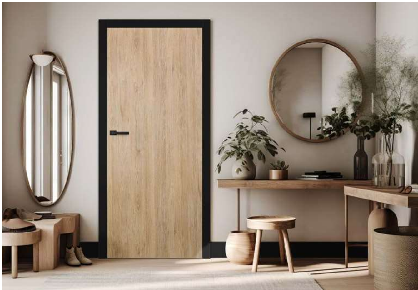
UNO PREMIUM, skrzydło dekor DĄB PREMIUM, ościeżnica CZARNY ST CPL, klamka CUBE PREMIUM czarny mat

SKRZYDŁA DRZWIOWE WEWNĄTRZLOKALOWE PRZYLGOWE, BEZPRZYLGOWE I REWERSYJNE