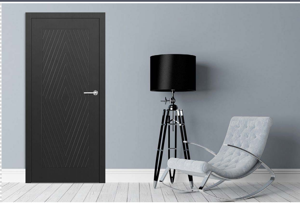
TURAN 3, klamka BELLA slim chrom błyszczący