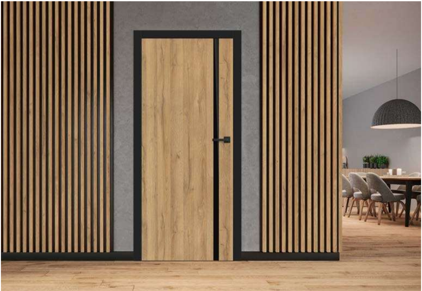
BALDUR 1, skrzydło dekor DĄB NATUR PREMIUM, ościeżnica dekor CZARNY ST CPL, klamka QUBIK czarny mat

SKRZYDŁA DRZWIOWE WEWNĄTRZLOKALOWE PRZYLGOWE, BEZPRZYLGOWE I REWERSYJNE